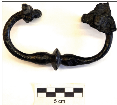
Ryc. 15. Antaba żelazna z badań w Kolegiacie NMP, stan po konserwacji.