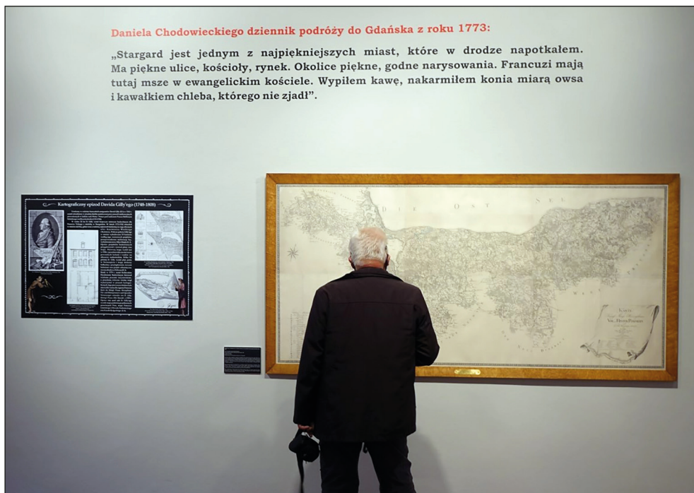
Ryc. 2. Wystawa czasowa „Imago Pomeraniae w kartografii pomorskiej od XVI do XVIII wieku”.