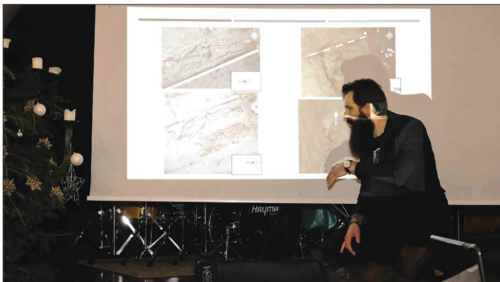
Ryc. 19. Wykład „Wyniki archeologicznych prac badawczych w sezonie 2020/2021”.