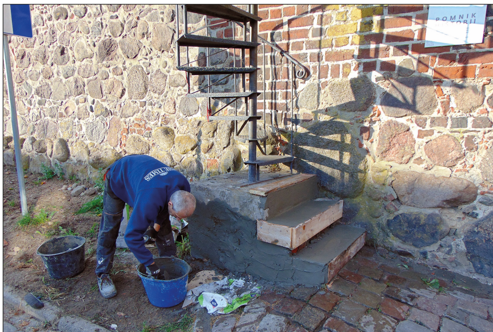
Ryc. 16. Prace remontowe przy Baszcie Morze Czerwone realizowane w ramach porozumienia MAH z Gminą Miastem Stargard, 8 października 2021 r.