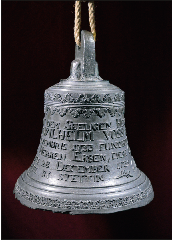
Ryc. 26. Dzwon ufundowany przez Wilhelma Vossa i zakupiony z projektu finansowanego przez Fundację PGE.

współpracującymi z nimi podmiotami działającymi na pograniczu polsko-niemieckim oraz dalszą intensyfikację działań prowadzonych na rzecz mieszkańców regionu przez Instytut Historyczny Uniwersytetu Szczecińskiego, Muzeum w Schwedt, Katedrę Zabytkoznawstwa Europejskiego Uniwersytetu Viadrina we Frankfurcie nad Odrą oraz partnerów stowarzyszonych: Instytut Historii Uniwersytetu w Greifswaldzie, Pommersches Landesmuseum i MAH w Stargardzie – projekt finansowany w ramach Programu Współpracy Interreg V A Meklemburgia-Pomorze Przednie / Brandenburgia / Polska.