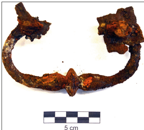
Ryc. 14. Antaba żelazna z badań w Kolegiacie NMP, stan przed konserwacją.