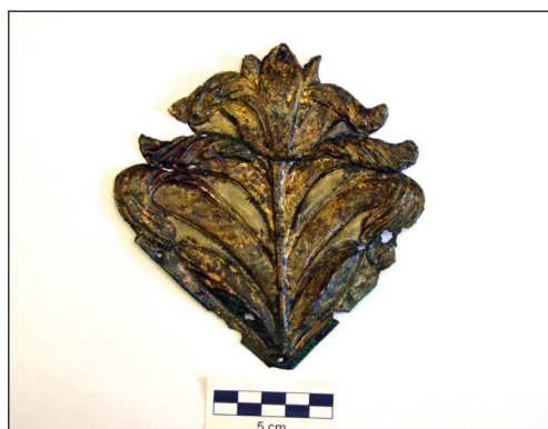
Ryc. 9. Aplikacja trumienna z krypty Adama von Weyhera z badań w kolegiacie NMP, stan po konserwacji. Fot. K. Sturm, MAH w Stargardzie