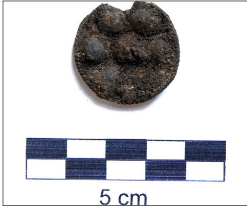
Ryc. 10. Cynowo-olowiana ozdoba w kształcie rozety z badań na kwartale XXIV, stan przed konserwacją.