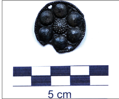
Ryc. 11. Cynowo-olowiana ozdoba w kształcie rozety z badań na kwartale XXIV, stan po konserwacji.