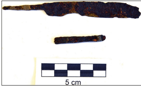
Ryc. 12. Fragmenty noży z badań na kwartale XXVIII, stan przed konserwacją.