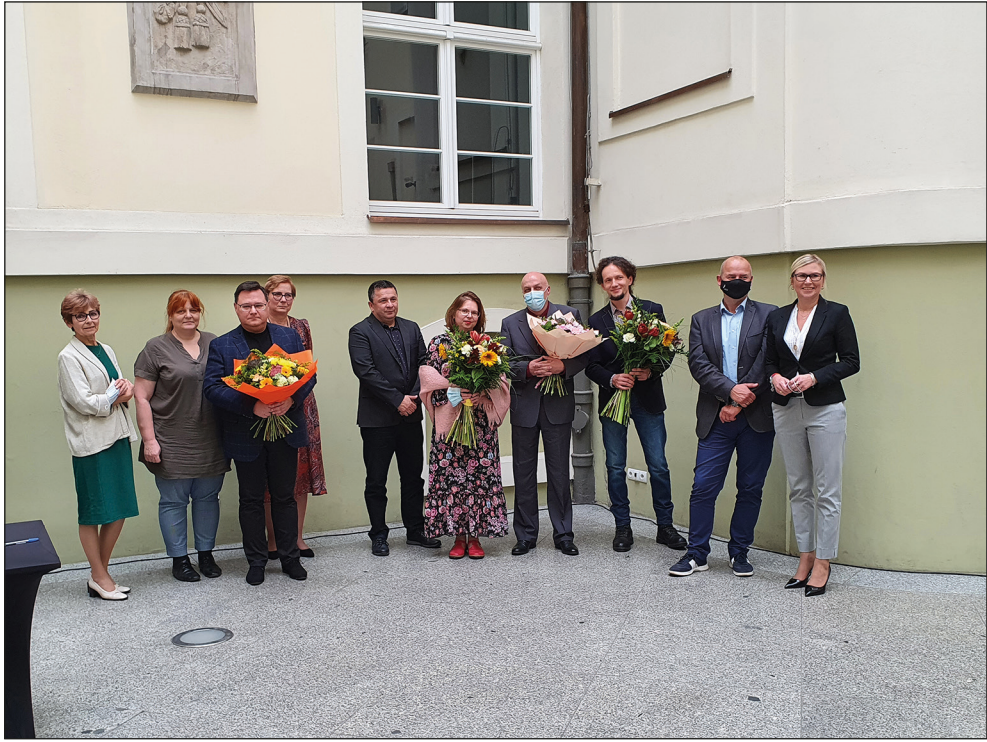
Ryc. 27. Nagrodzeni i wyróżnieni w konkursie „Zachodniopomorskie Muzealne Wydarzenie Roku 2020”.