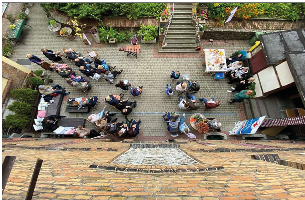
Ryc. 25. Koncert „Dźwięki kamienicy” z okazji Europejskich Dni Dziedzictwa.