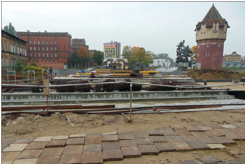
Ryc. 18. Przebudowa wiaduktu kolejowego na wysokości dworca PKP, 18 października 2021 r.