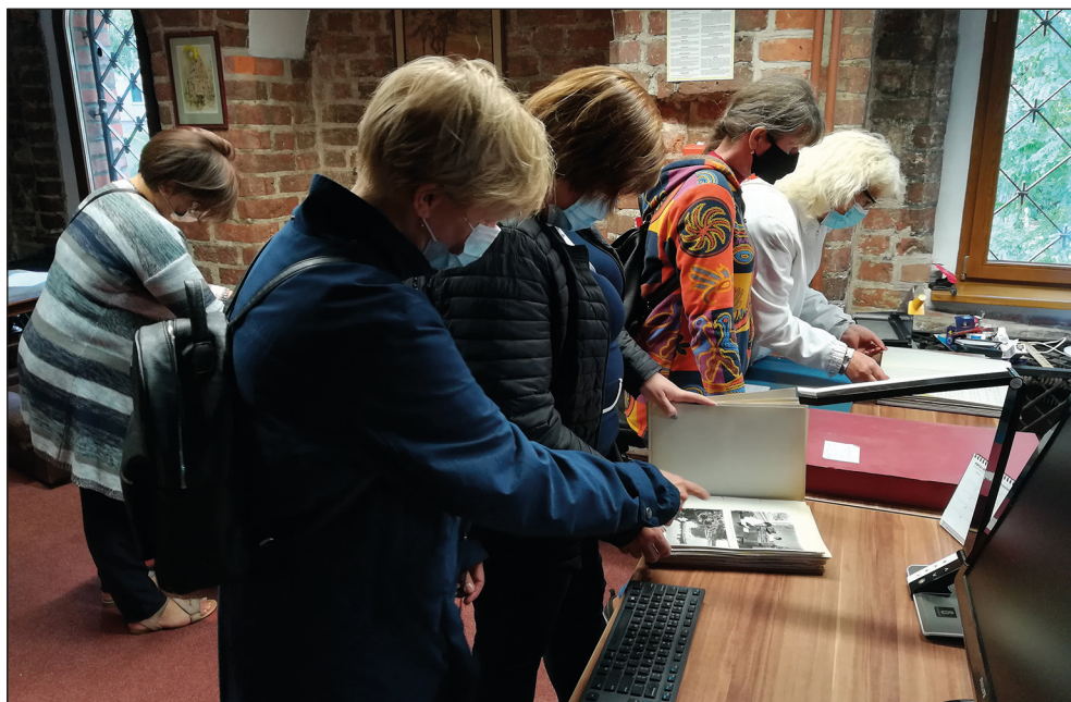
Ryc. 24. Wizyta w Archiwum Państwowym w Szczecinie, oddział w Stargardzie podczas spaceru historycznego „Skarbce i skarbnicy pamięci” realizowanego w ramach Europejskich Dni Dziedzictwa.