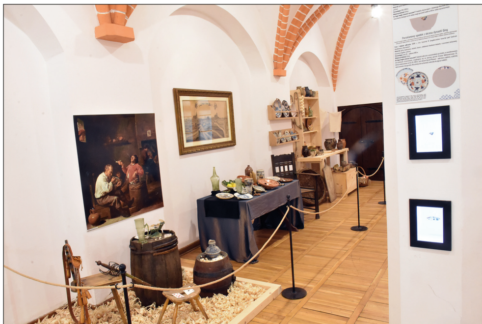
Ryc. 3. Wystawa czasowa „Pobite gary”.