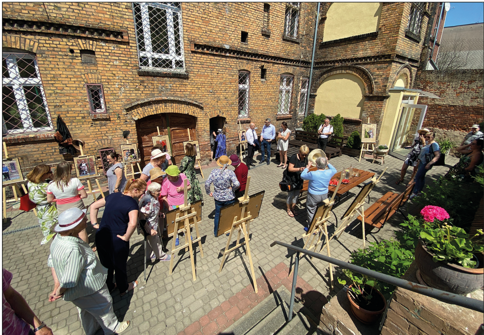
Ryc. 5. Wystawa „Poznaj moją historię” w Dziennym Domu „Senior+”.