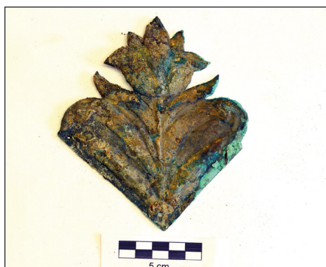
Ryc. 8. Aplikacja trumienna z krypty Adama von Weyhera z badań w kolegiacie NMP, stan przed konserwacją.

Pracownia Konserwacji prowadziła prace konserwatorskie zabytków archeologicznych pozyskanych w trakcie badań archeologicznych w poprzednich latach przez