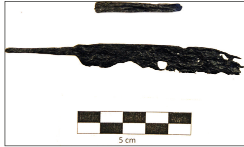
Ryc. 13. Fragmenty noży z badań na kwartale XXVIII, stan po konserwacji.