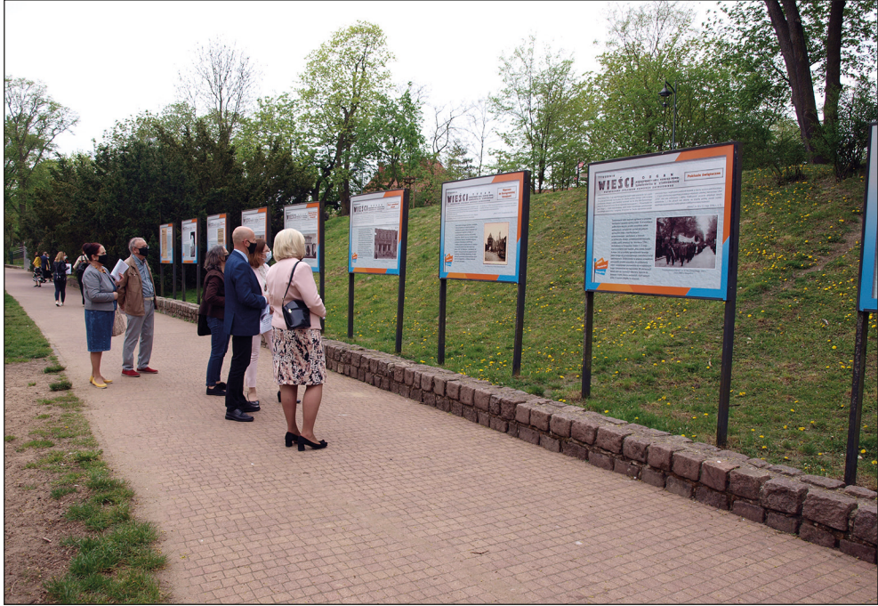
Ryc. 4. Wystawa planszowa „Wieści z wieści”.