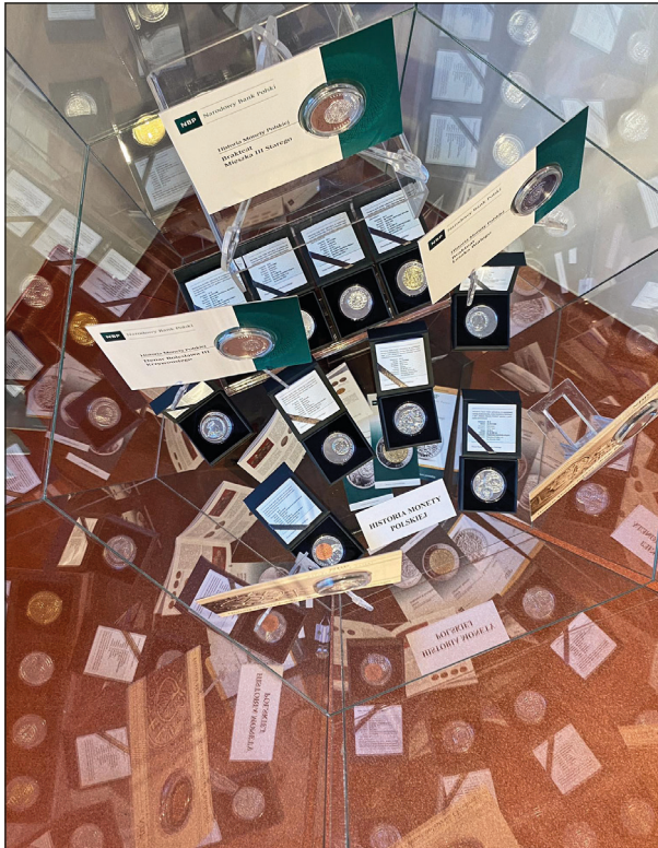
Ryc. 1. Wystawa czasowa „Polska i Polacy. Wybór monet okolicznościowych przekazanych na przestrzeni lat przez NBP do zbiorów MAH w Stargardzie”.