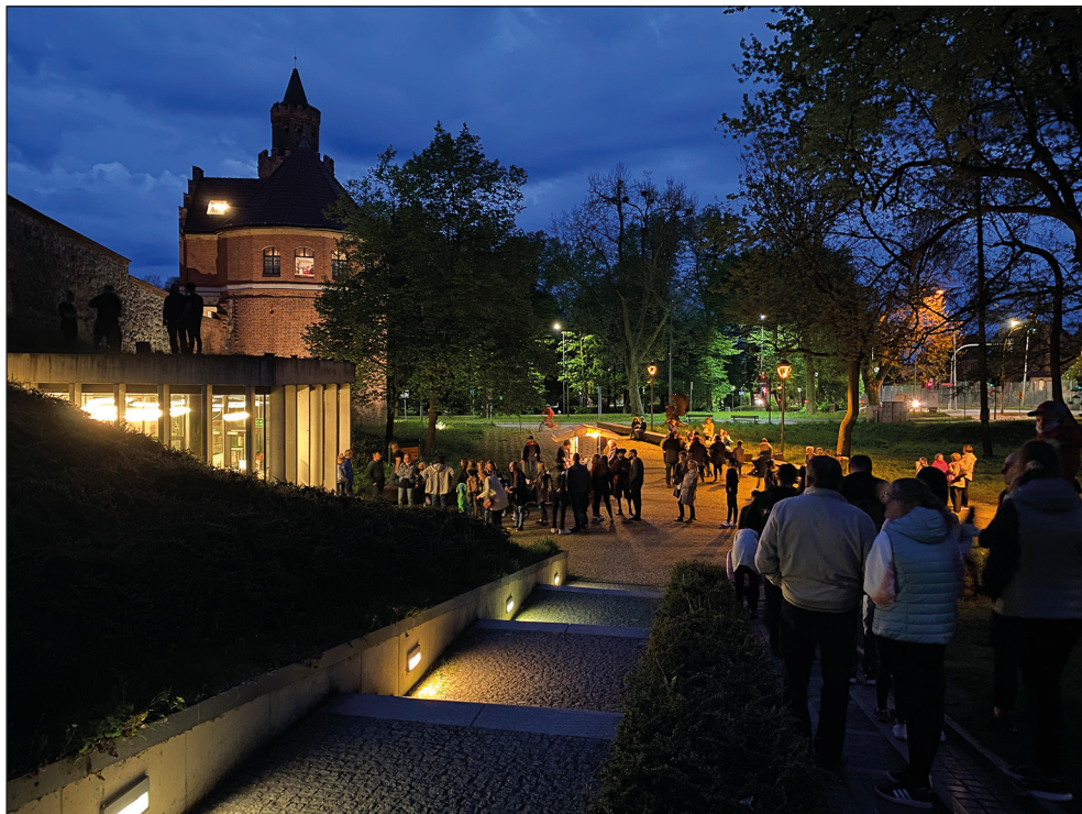
Ryc. 21. Stargardzka Noc Muzeów.