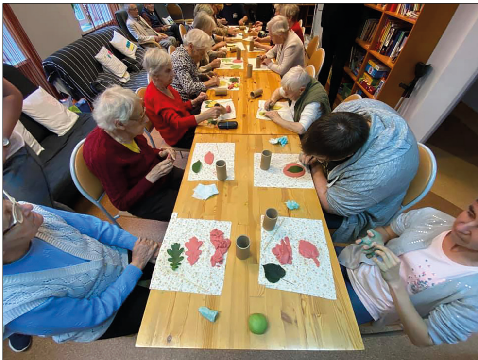
Ryc. 28. Zajęcia w Dziennym Domu Senior+.