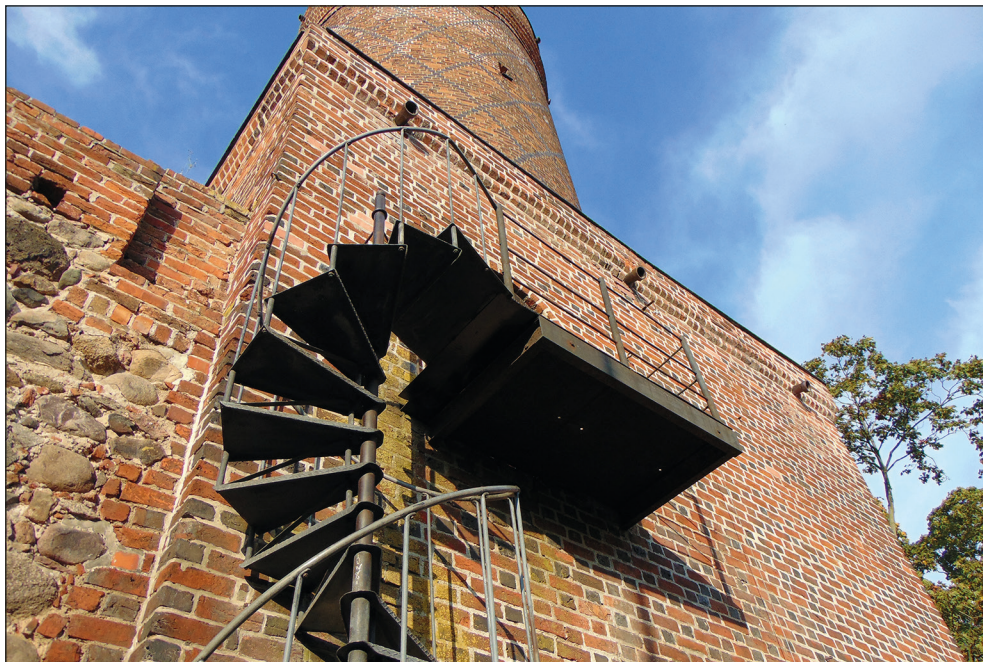
Ryc. 17. Prace remontowe przy Baszcie Morze Czerwone realizowane w ramach porozumienia MAH z Gminą Miastem Stargard, 8 października 2021 r.