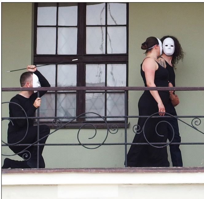
Ryc. 22. Przedstawienie „Opowieści legendą podszyte”. Fot. Sławek Alex