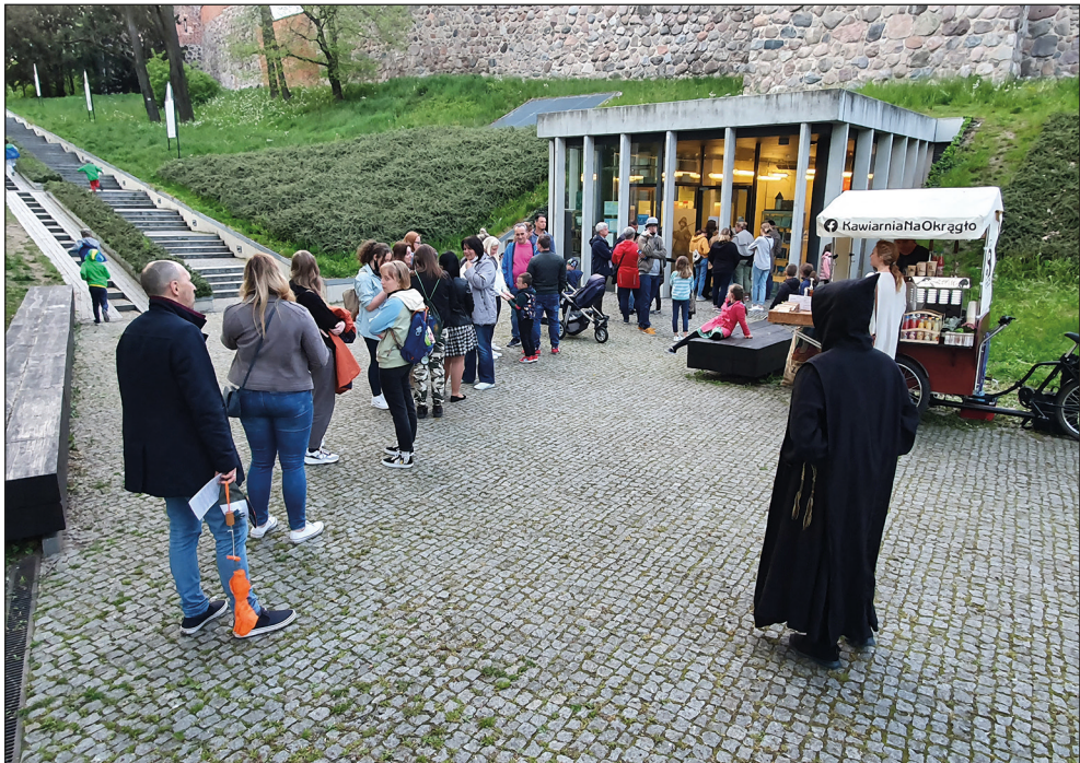
Ryc. 20. Stargardzka Noc Muzeów.