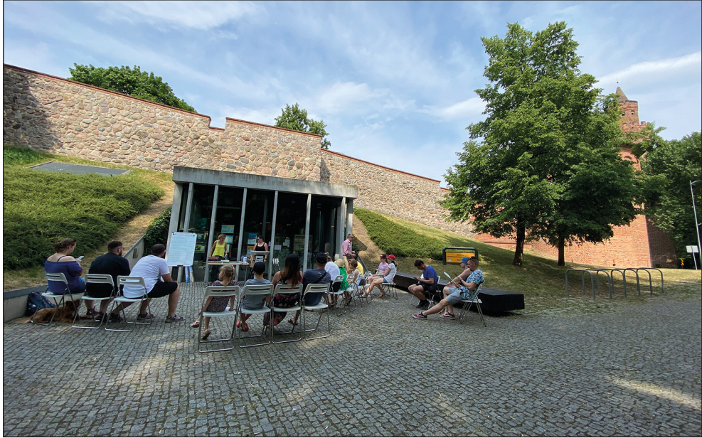
Ryc. 6. III Quiz Gryfa z okazji Dni Stargardu.